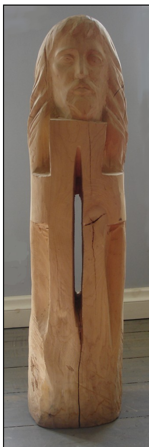
Kristusbild i Rapla församlingens hem utformad av en armenisk konstnär.

När det förkunnas, att Jesus redan har gjort allt för vår frälsning och