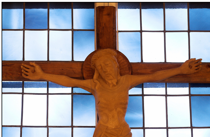
Detalj av crucifixet i Lappfjärds församlingshem.

Ingen kan ta evangeliet åt sig. Det ges oss som en gåva av Guds nåd. Och den som får det, måste för att få behålla det kämpa mot sitt kött och världen och djävulen under hela sitt jordeliv. Men det lönar sig att kämpa,